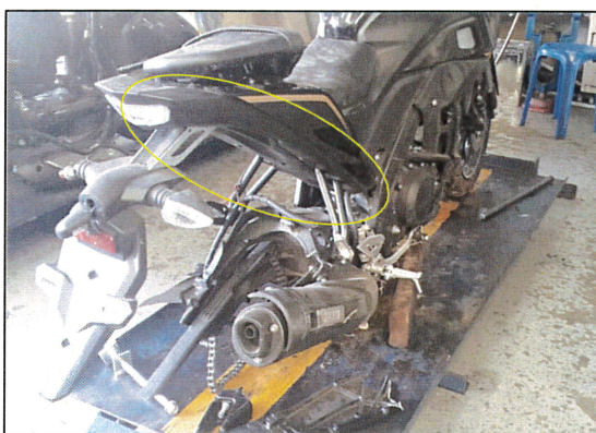
บังโคลนชும்ล้อหลังไม่มีรอยเสียดสีกับยางล้อหลัง