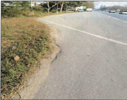
จุดที่ได้รับการแจ้งว่ารถตกหลุมเสียหลัก