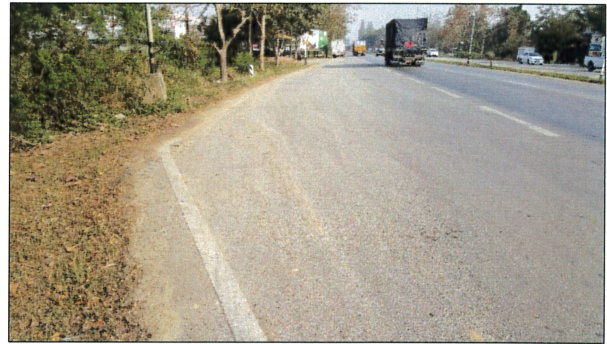
พื้นผิวถนนไม่มีร่องรอยการขีดขีดจากการหักของสวิงอาร์ม

สาเหตุที่ทำให้ตัวรถได้รับความเสียหายในครั้งนี้ สันนิษฐานได้ว่าเกิดจากการประสบเหตุทำให้รถเสียการควบคุมตกลงข้างทางและกระแทกพื้นทางด้านซ้ายอย่างรุนแรงก่อนที่จะสะบัดไปด้านขวากระแทกกับพื้นไถลกับไปพื้นอีกครั้ง จุดที่ได้รับกระแทกมากที่สุดคือ บริเวณชุดล้อหลังที่ติดกับชุดสวิงอาร์ม โดยเพลากล้อหลังเกิดการคดงอ มีรอยฉีกขาดที่ชุดยางล้อหลัง ซึ่งแรงกระแทกนี้เป็นเหตุให้ชุดสวิงอาร์มข้างเกิดการบิดตัวและแตกหัก